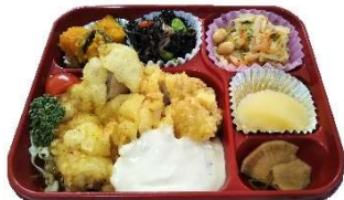
大人気! 甘酢たっぷりチキン南蛮♪